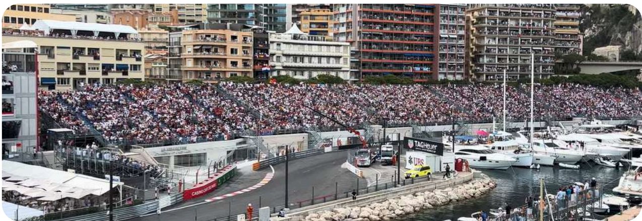
Uitzicht vanaf de Grandstand...

Tribune O (Piscine Plongeur) is de hoogste van de drie tribunes in de haven. Deze tribune zit tegenover het zwembadgedeelte van het circuit. Als u het zich kunt veroorloven, is O een betere keuze dan de Grandstands N of P. Deze tribunes zitten aan de rechter- en linkerkant van Tribune O. Dit is omdat de uitzichten beter zijn en u ook een ver zicht van de pitsstraat krijgt. Neem dus vooral een verrekijker mee! Alle drie de tribunes hebben uitzicht op een tv met groot scherm.