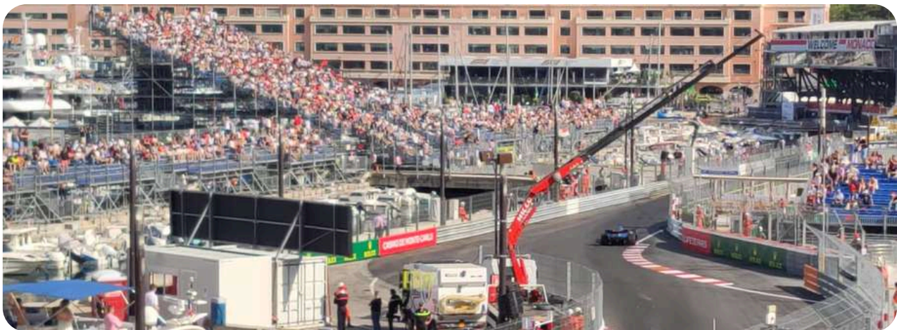
Uitzicht vanaf de Grandstand K

Tribune K is een grote en populaire haventribune. Hier heeft u een mooi uitzicht vanaf de uitgang van de Nouvelle Chicane en de Tabac-bocht. Helemaal tot aan de ingang van het zwembadcomplex. Zitplaatsen in de hoogste rij van K bieden ook uitzicht achter de tribune. Dan ziet u de pitsstraat, start / finish en bocht 1 (Sainte Devote).