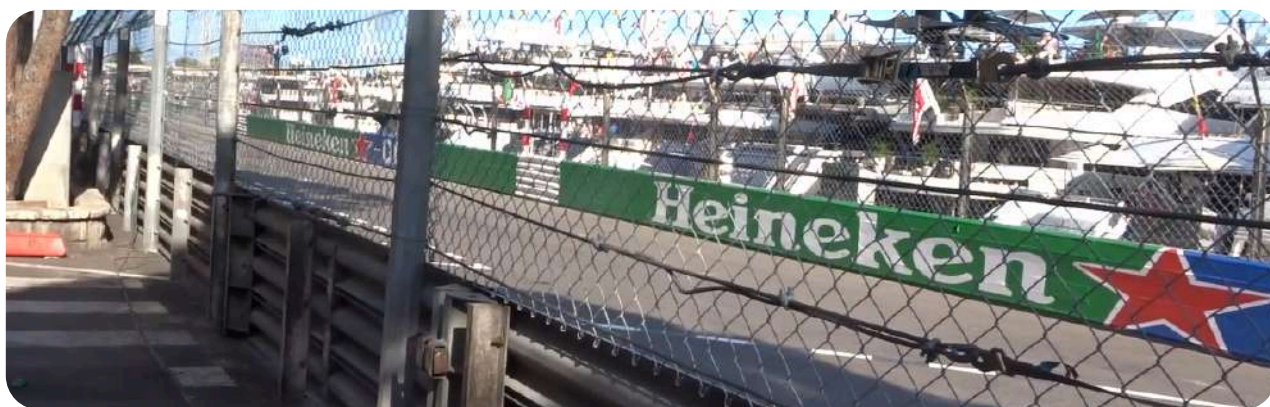
Uitzicht vanaf General admission zone Z

Grandstand T is een hele mooie tribune. U heeft vanaf hier zicht op de pitlane en de pitgarages. In Monaco is het lastig om in te halen, waardoor posities vaak worden gewonnen tijdens de pitstops. Dit kunt u vanaf deze tribune goed bijwonen. Zit u aan de rechterkant van de tribune, dan kunt u de auto's uit bocht 15 zien komen en richting bocht 16 rijden. Zit u aan de linkerkant, dan ziet u de auto's richting bocht 18 rijden. Het upper gedeelte van Grandstand T is overdekt.