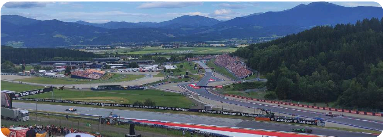
Uitzicht vanaf de Turn 3 Grandstand

Deze grote grandstand bevindt zich tussen bochten 1 en 2. Hier heeft u een redelijk panoramisch uitzicht over een groot deel van het circuit. De duurste stoelen bevinden zich in sectie A en B die het dichtst bij bocht 1 liggen. Kaartjes worden dan steeds goedkoper tot sectie K, wat een heel eind van bocht 1 vandaan is richting bocht 2. Vanaf de middelste secties heeft u goed zicht op de binnenste circuitbochten 6-7.