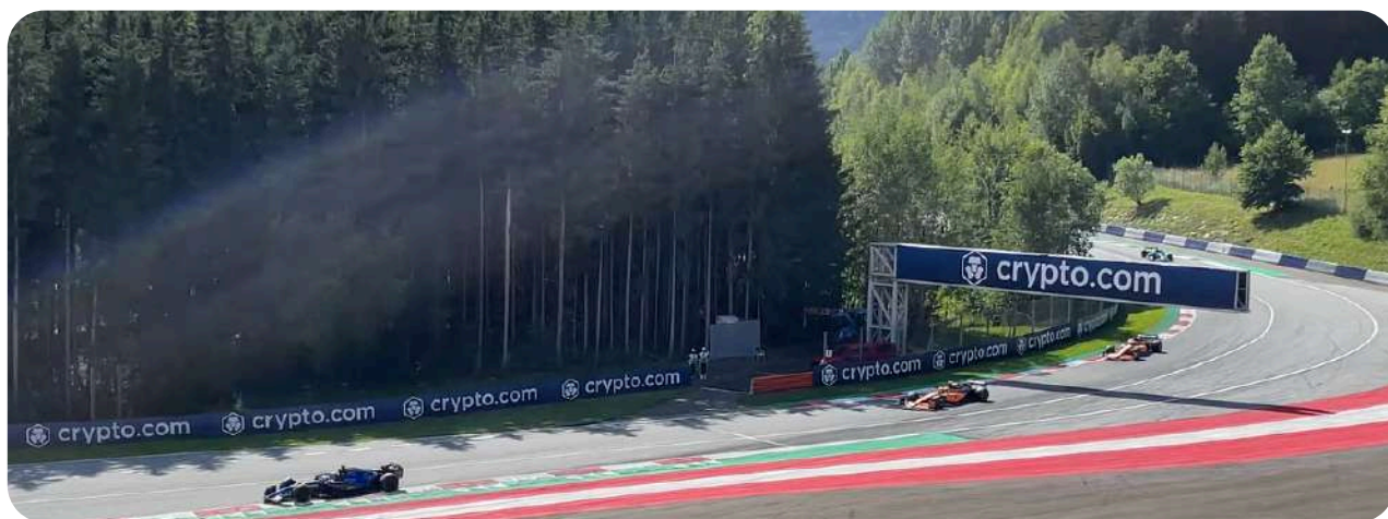
Uitzicht vanaf de Turn 9 Grandstand

Een ruim televisiescherm zorgt ervoor dat u niets van de race-actie hoeft te missen. En goed nieuws, de tickets voor tribune 9 behoren tot de meer betaalbare opties behoren op de Red Bull Ring.