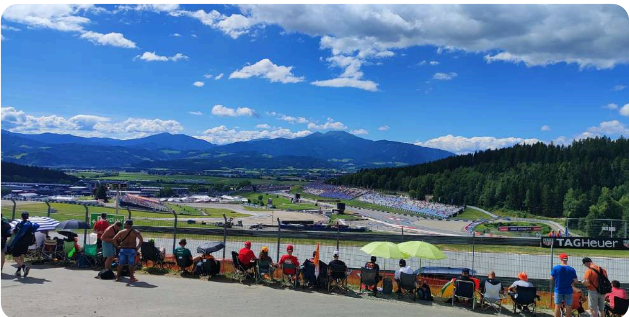
Uitzicht General Admission rondom bocht 3

Gelet op de lage prijzen voor de algemene toegangsplaatsen is dit een van de beste races om laagdrempelig te bezoeken. Helemaal omdat het de thuisrace van het raceteam van Max Verstappen is.