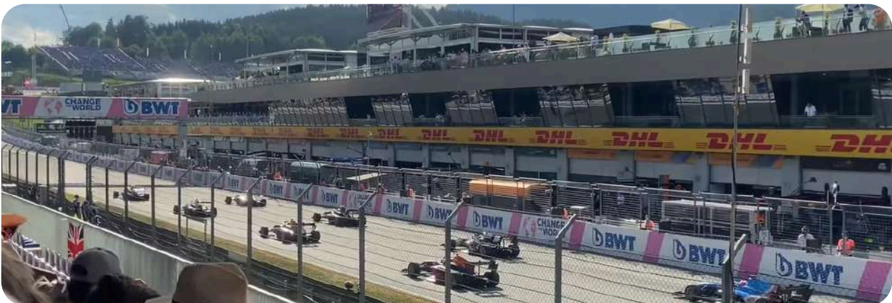
Uitzicht vanaf de Grandstand sectie G

Verderop in de gids zult u meer kunnen lezen over het uitzicht van deze grandstands.