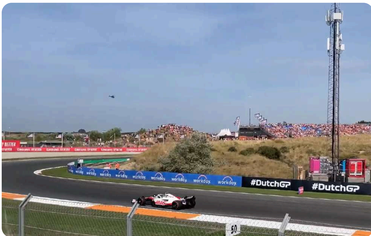
Uitzicht vanaf General Admission bochten 8 & 9

In Zandvoort zijn er twee General Admission-zones. Als u alleen tickets heeft voor General Admission zone 1, heeft u geen toegang tot de tweede zone, en vice versa. De prijzen voor de zones zijn ongeveer gelijk, maar met tickets voor General Admission 1 heeft u toegang tot een grotere ruimte.