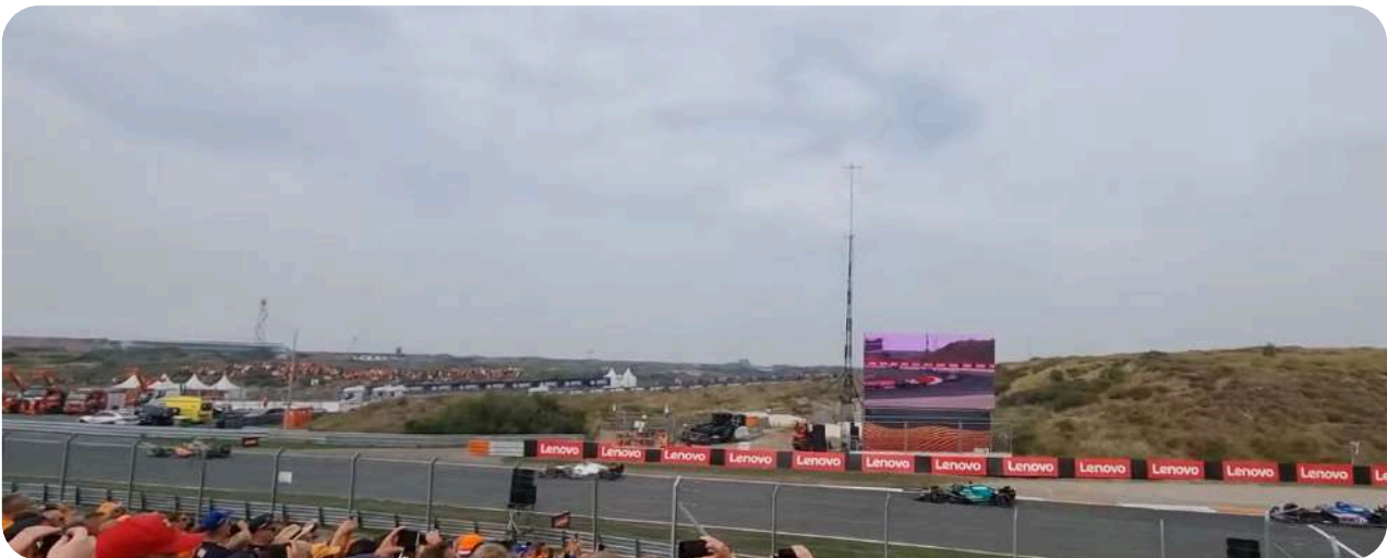
Uitzicht vanaf Hairpin 1 / 2 Grandstand

Deze tribune is gelegen vlak voor de laatste 2 bochten van het circuit, ook wel bekend als de curve. Vanaf deze tribune zult u de auto's met hoge snelheid aan zien komen terwijl ze licht moeten remmen voordat ze de kombocht ingaan. Hoewel inhaalacties misschien niet recht voor u plaatsvinden, is het nog steeds een prima tribune om de laatste lootjes van een ronde mee te maken.