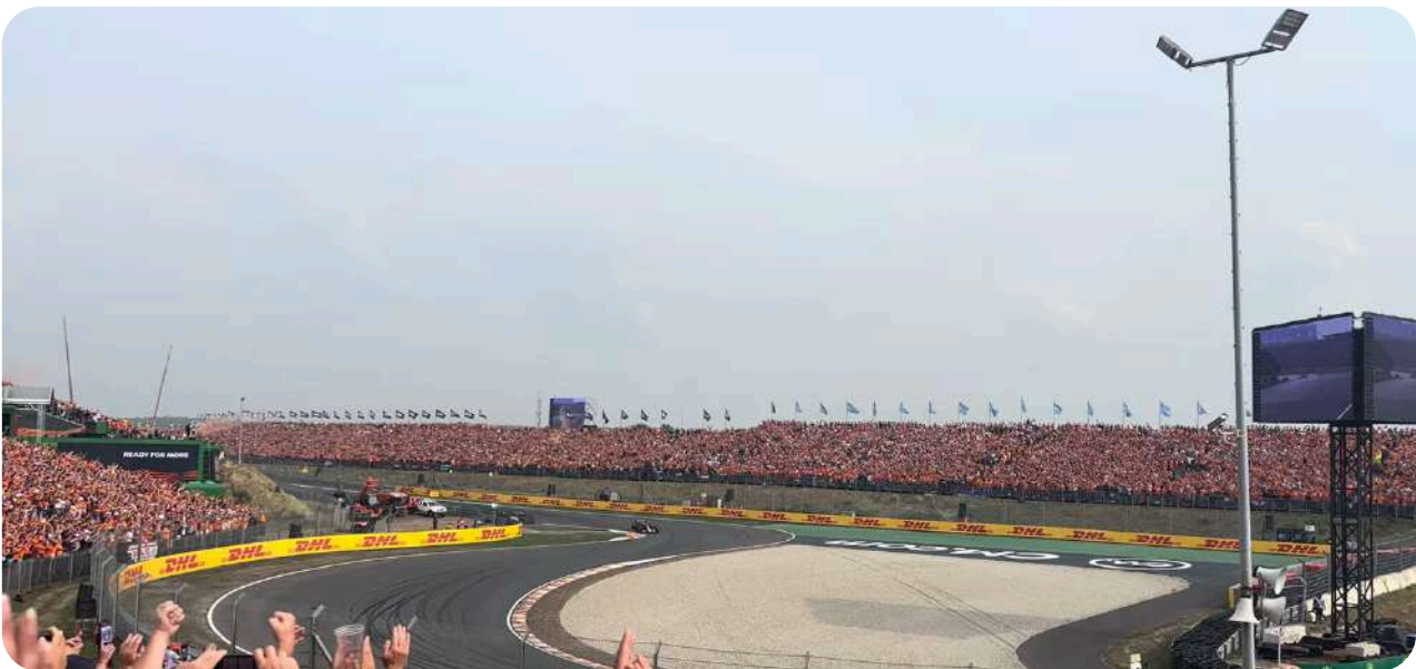
Uitzicht vanaf de Arena-In 1 Grandstand

Deze tribunes bieden uitstekende uitzichten en bieden een perspectief dat vergelijkbaar is met Eastside 3. Dit betekent dat u een goed zicht heeft op hoe coureurs hard afremmen om de Arena sectie in duiken. Echter, het uitzicht is iets minder uitgebreid. De Arena-In 1 / 2 tribune wordt wordt wel beschouwd als de beste zilver tribune op Zandvoort.