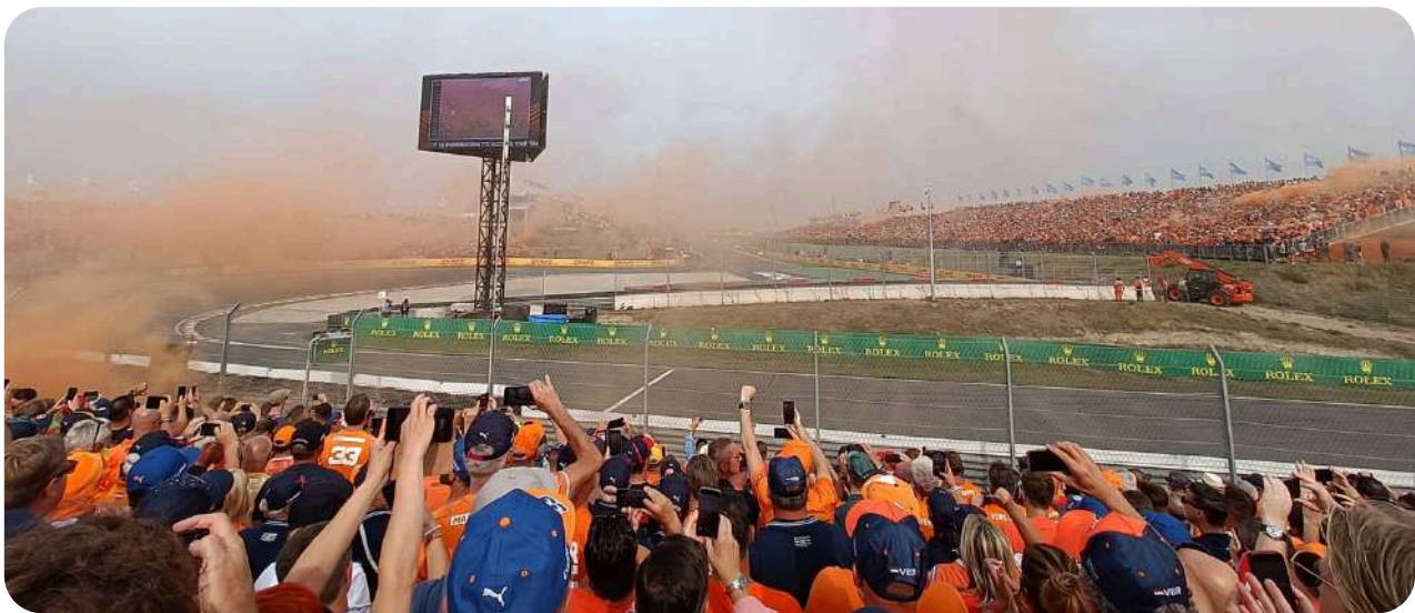
Uitzicht vanaf de Arena 1 Grandstand

Aangezien Eastside 3 het dichtst bij de Arena sectie ligt, is deze het duurt van de 3 Eastside tribunes, maar het biedt uitstekende waarde voor wat u betaalt en het uitzicht wat u krijgt