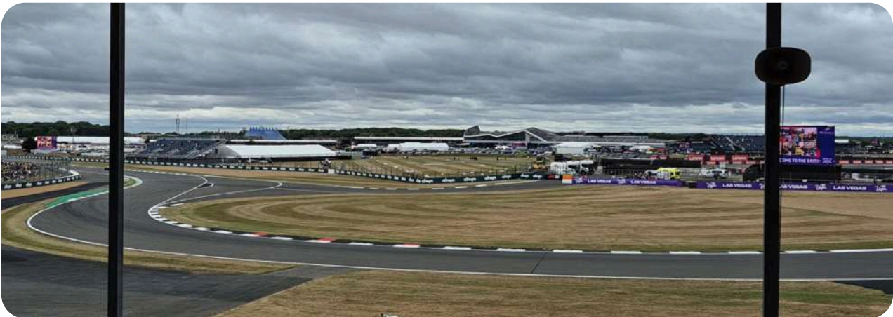
Uitzicht vanaf de Becketts Grandstand

De Becketts bochtencombinatie is niet de beste plek voor inhaalacties. Vanaf deze tribune heeft u naast Maggotts en Becketts ook zicht op bochten 4 en 5. De Becketts tribune is overdekt.