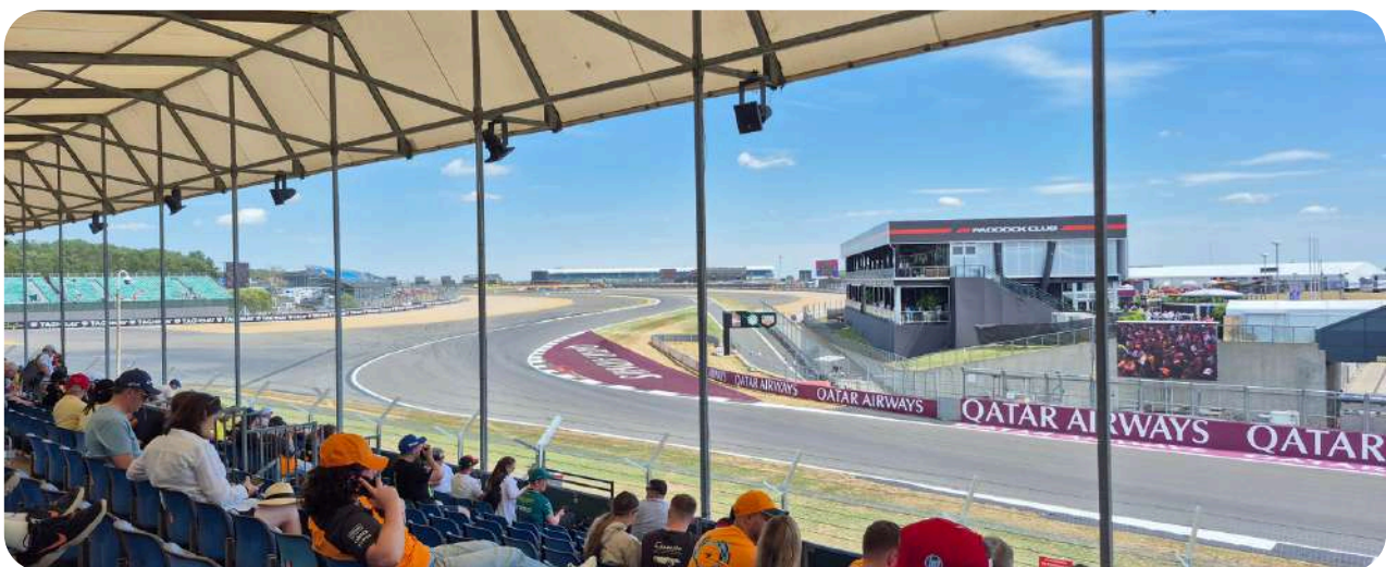
Uitzicht vanaf de Abbey B Grandstand

De View Grandstand geeft een geweldig zicht over de eerste bochten. U heeft een goed zicht op de start van de race en op de uitgang van de pitstraat. Het verschilt wel een beetje aan welke kant van de grandstand u zit. Vanaf de rechterkant van de grandstand zult u meer van de start kunnen zien dan van de linkerkant. Maar ook vanaf de linkerkant van de grandstand heeft u nog een goed zicht van de auto's die door de eerste bocht scheuren na de start van de race wanneer alles nog dicht bij elkaar ligt. De grandstand is niet overdekt. Over het algemeen is dit is een uitstekende tribune op het circuit van Silverstone.