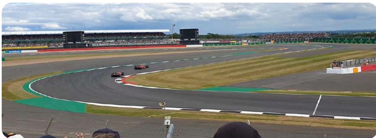
Uitzicht vanaf de Village A Grandstand

De Luffield Grandstand ligt net na bocht 7. Vanaf deze grandstand kunt u nog steeds de auto's vanuit bocht 6 zien aankomen en ziet u hoe ze accelereren richting bocht 8. Beide grandstands zijn overdekt. Van de twee zouden wij de Luffield Grandstand aanraden.