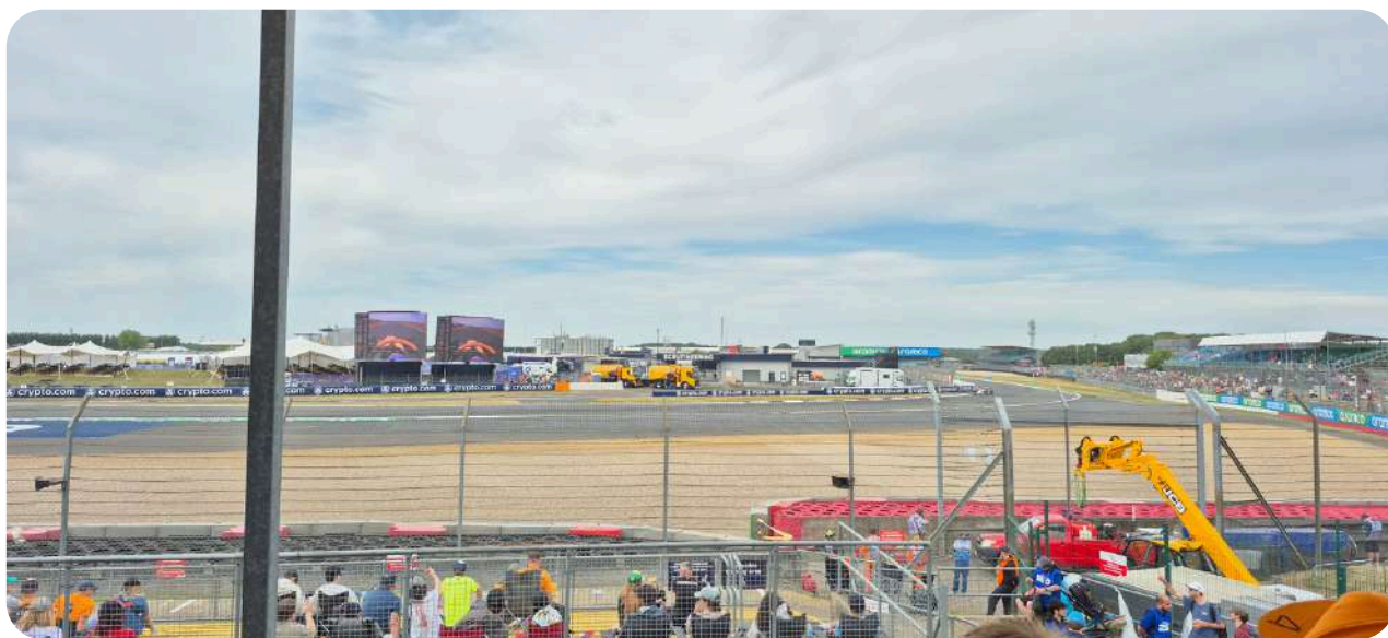
Uitzicht vanaf de Copse C Grandstand

Chapel is de laatste grandstand in de technische bochtencombinatie 'Maggotts and Becketts' en biedt hier een mooi panoramisch uitzicht op. Deze hele snelle bochten zijn zeer bekend op het circuit van Silverstone. De Chapel tribune is gelegen bij bocht 14; u ziet hier de auto's recht op u afkomen terwijl ze door bocht 12 en 13 scheuren. Deze grandstand is niet overdekt.