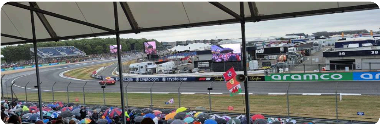
Uitzicht vanaf de Stirling B Grandstand

Vanaf deze Grandstands ziet u de auto's vanuit bocht 8 komen en naar de snelle Copse-bocht rijden. Van de twee biedt Stirling B een beter uitzicht op de Copse-bocht. Grandstand Stirling B is overdekt, Stirling A niet.