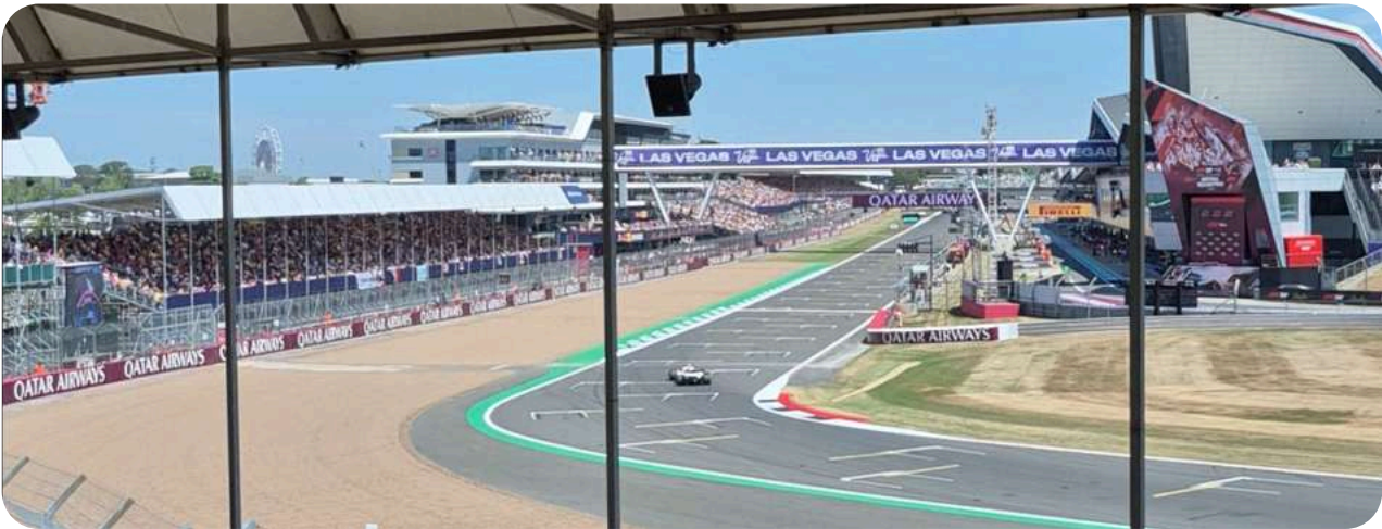
Uitzicht vanaf Vale Grandstand