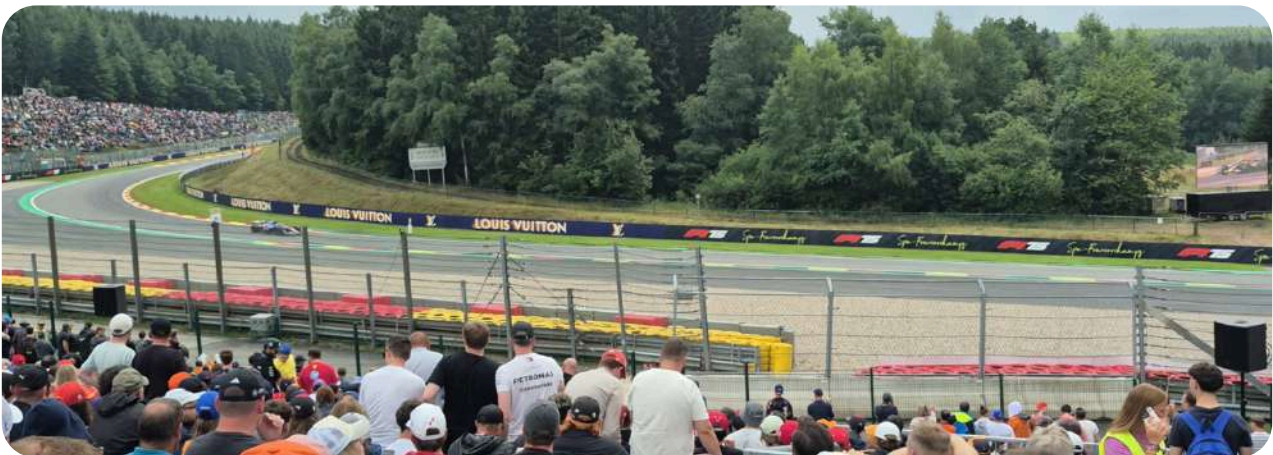
Uitzicht vanaf de Silver 3 Grandstand

De Silver 1 Grandstand is gelegen op het stuk van het circuit tussen La Source en Eau Rouge. U heeft vanaf deze grandstand dan ook een mooi zicht op het stuk tussen beide bochten en kunt de auto's uit La Source zien komen en door Eau Rouge zien gaan. U heeft nog steeds een individueel genummerde zitplaats in de Silver 1 grandstand, maar deze zijn in bleacher-stijl. Daarnaast hebben ze geen rugleuning om tegen te leunen waardoor het iets minder comfortabel kan zijn dan andere grandstands. Houd er ook rekening mee dat het hek aan de onderkant van de tribune het uitzicht vanaf de onderste rijen beperkt. De Silver 1 Grandstand is niet overdekt.