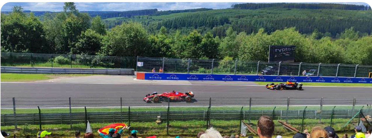
Uitzicht vanaf General Admission Kimmel Straight

Deze tribune is toegankelijk voor bezoekers van 17 tot 27 jaar. Hij bevindt zich nabij bocht 14, net voor Blanchimont, de lange rechte lijn aan het einde van het circuit. De prijzen voor deze Grandstand behoren tot de meest betaalbare opties in België maar hij is niet overdekt.