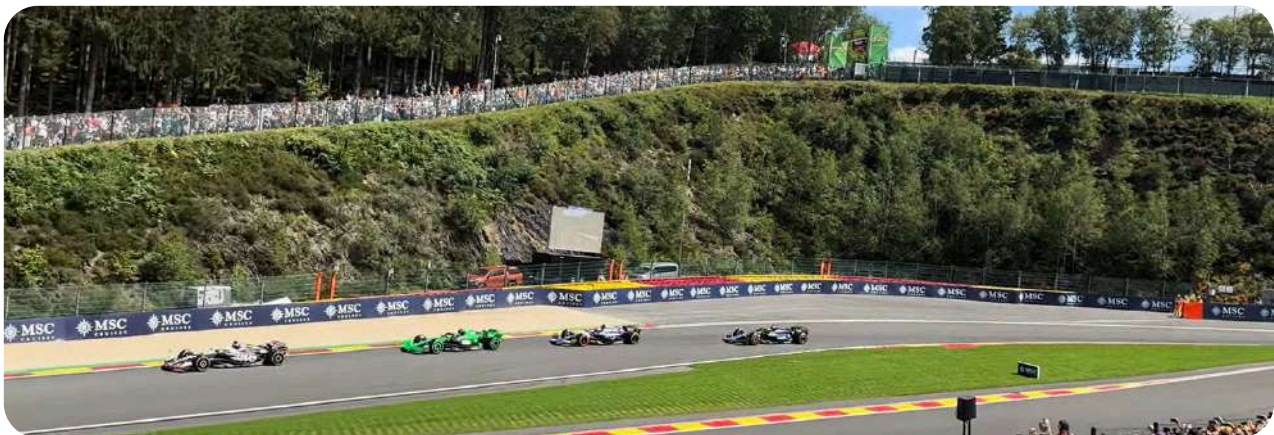
Uitzicht vanaf de Speed Corner Grandstand

Silver 5 ligt bij de uitgang van de Pouhon bocht. U ziet hier de auto's uit deze bocht komen voordat ze bocht 13, Fagnes, ingaan. De tribune ligt naast Tribune 6, qua uitzicht zou Tribune 6 net wat interessanter zijn. De zitjes hebben een rugleuning en zijn genummerd, maar de tribune is niet overdekt.