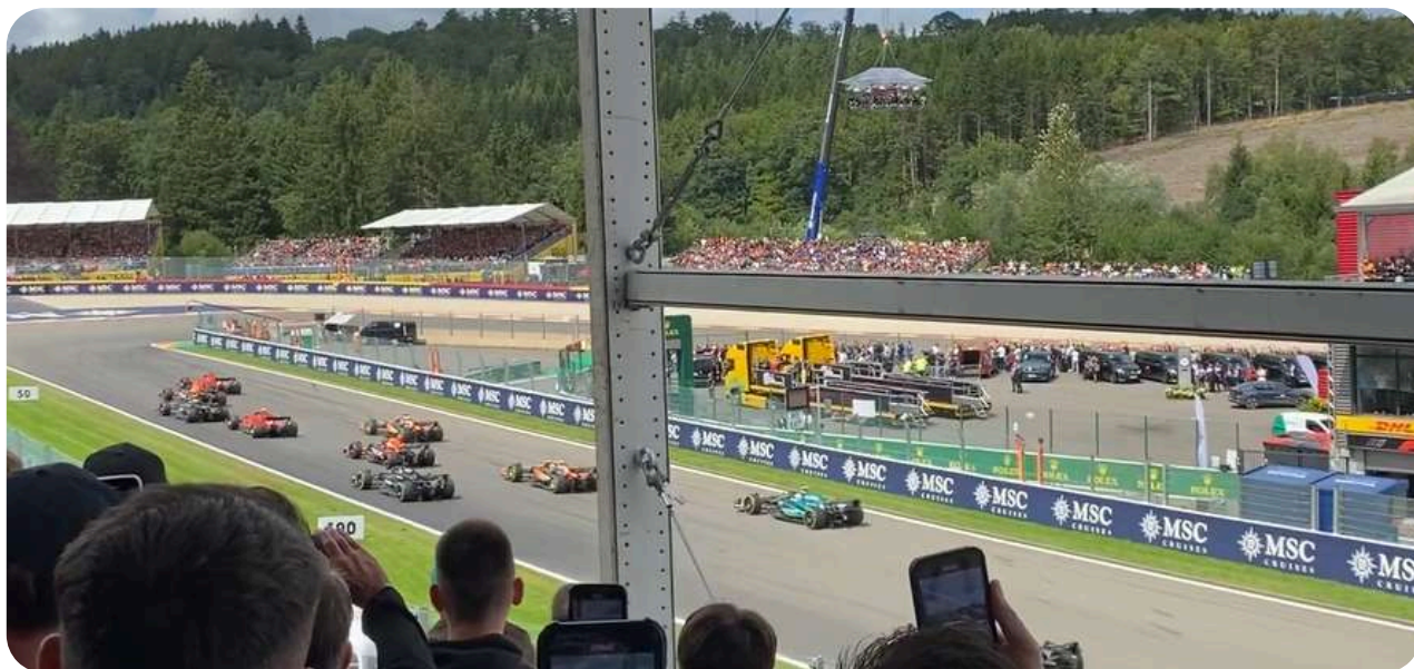
Uitzicht vanaf de Gold 9 Grandstand

Gold 8 ligt bij de La Source-hairpin (bocht 1) en biedt uitzicht op de start-finishlijn. De populariteit van deze tribune is duidelijk, aangezien deze vaak als eerste is uitverkocht. Het uitzicht is geweldig en als de tickets beschikbaar zijn, raden wij aan deze zo snel mogelijk te kopen. U heeft hier zicht op de start-finish en kunt de auto's ook de La Source-bocht uit zien rijden. De grandstand is overdekt.