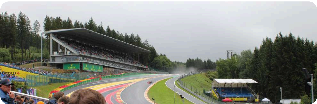
Uitzicht vanaf de Fanzone Grandstand

U kunt Eau Rouge in de verte zien, maar er zijn betere uitzichten beschikbaar voor deze prijs.