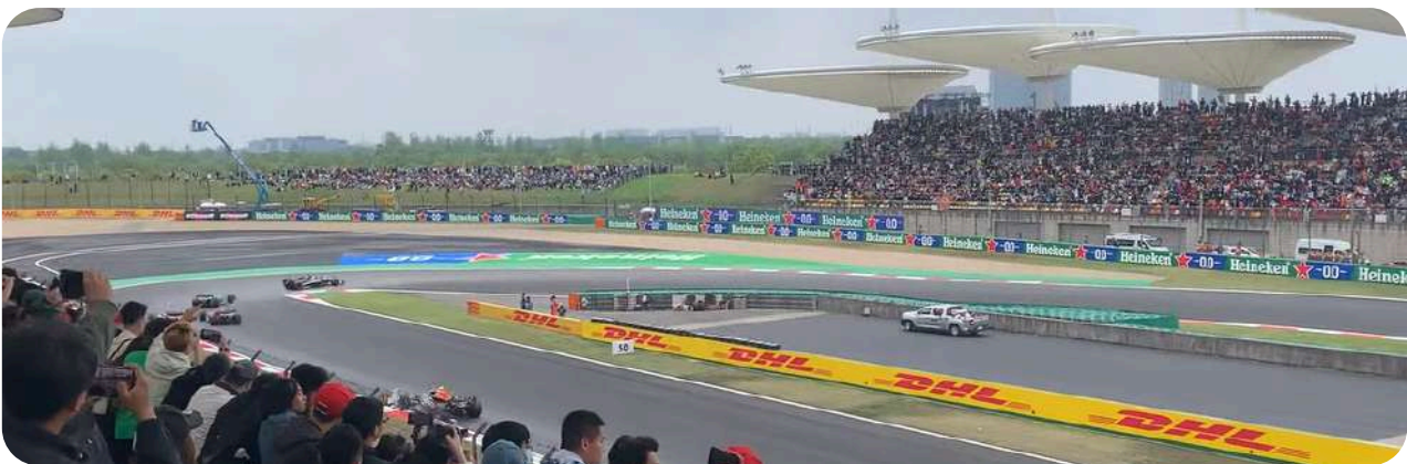
Uitzicht vanaf de Grandstand H

Tribune B is gelegen aan het einde van het rechte stuk. Vanaf hier heeft u uitzicht op de actie bij bochten 1 tot 6. Daarnaast kunt u ook de startgrid en de finishlijn zien.