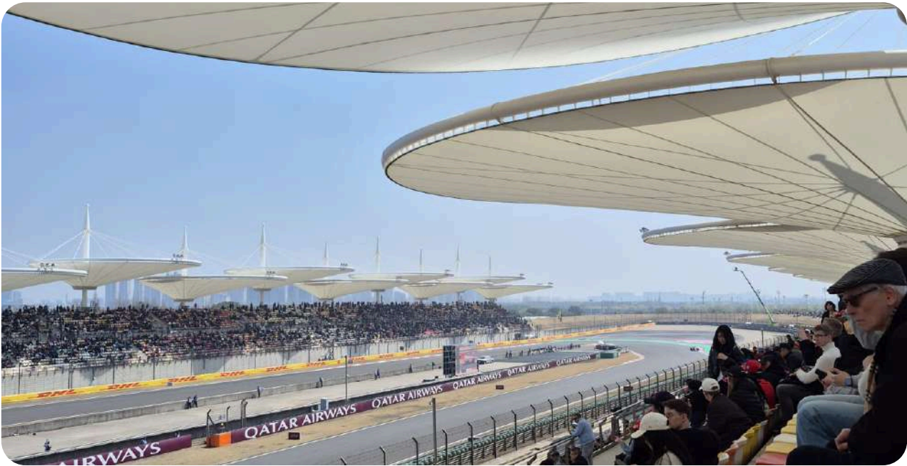
Uitzicht vanaf Grandstand K

Tribune K is gelegen tussen bocht 15 en de laatste bocht 16. Hier kunt u de coureurs zien versnellen nadat ze uit bocht 14 komen en remmen voor bocht 16. Het is tegenover Tribune H gelegen.