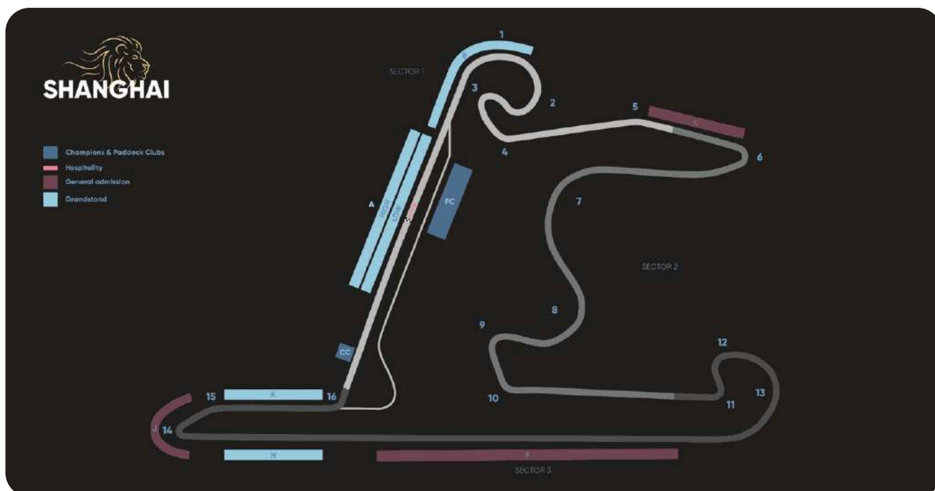
Shanghai International Circuit

Op de volgende pagina's vindt u een overzicht van de verschillende tribunes die beschikbaar zijn op het Shanghai International Circuit in China. Per tribune geven wij informatie over het uitzicht en welke delen van het circuit u kunt volgen, zodat u een goed beeld krijgt van wat u kunt verwachten en de optie kunt kiezen die het beste bij u past.