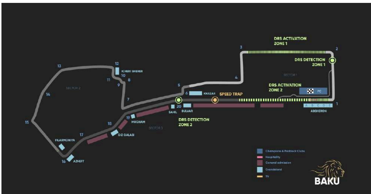
Circuit Layout Baku City Circuit

Hieronder vindt u een overzicht van de verschillende soorten tickets die beschikbaar zijn voor het Baku City Circuit in Azerbeidzjan. Daarnaast vindt u informatie over het zicht dat de verschillende tickets bieden en of ze de prijs waard zijn.