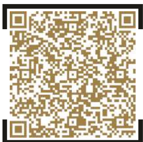
Baku Grand Prix Tickets