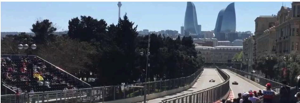
Uitzicht vanaf de Khazar Tribune

De laatste tribune in dit gedeelte van het circuit is de Mugham tribune . Deze is gelegen bij bocht 19 en biedt een goed uitzicht op de auto's die bocht 19 verlaten en bocht 20 ingaan.