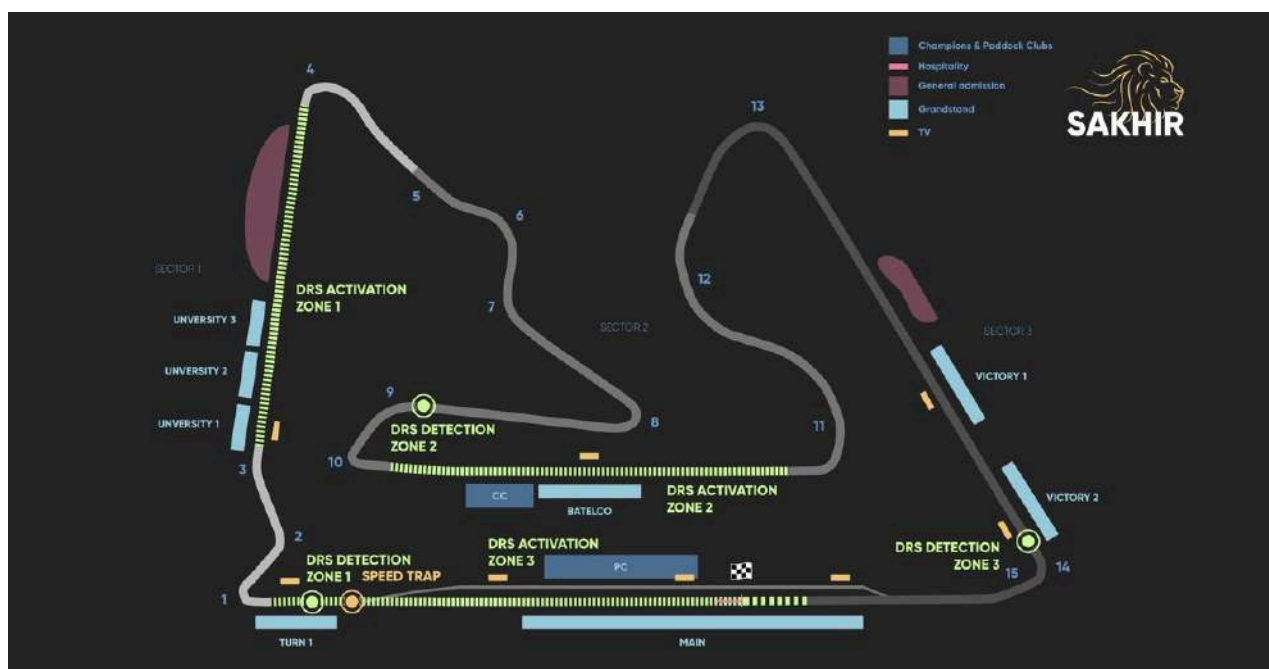
Circuit Layout Bahrain Circuit

Hieronder vindt u een overzicht van de verschillende soorten tickets die beschikbaar zijn voor de Grand Prix van Bahrein. Daarnaast vindt u informatie over het zicht dat de verschillende tickets bieden en of ze de prijs waard zijn.