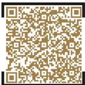
Bahrein Grand Prix Tickets