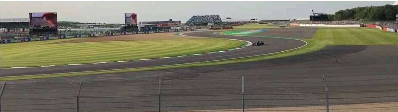
Uitzicht vanaf Chapel Tribune

De tribune Vale is gelegen bij bocht 16. U heeft een fantastisch zicht over de bochtencombinatie 16, 17 en 18. Verder heeft u een goed zicht over de ingang van de pitstraat zodat u live alle strategieën kunt volgen. De tribune is een van de goedkoopste op het circuit van Silverstone.