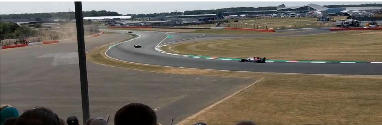
Uitzicht vanaf de Becketts Tribune

Hamilton B is niet overdekt. Door de Red Bull-hospitality is het zicht op de laatste paar bochten beperkt. De tribune bevindt zich direct aan de start/finishlijn, wat een geweldig uitzicht biedt op de start van de race en bocht 1. Daarnaast heeft u een goed zicht op de pitboxen van de topteams.