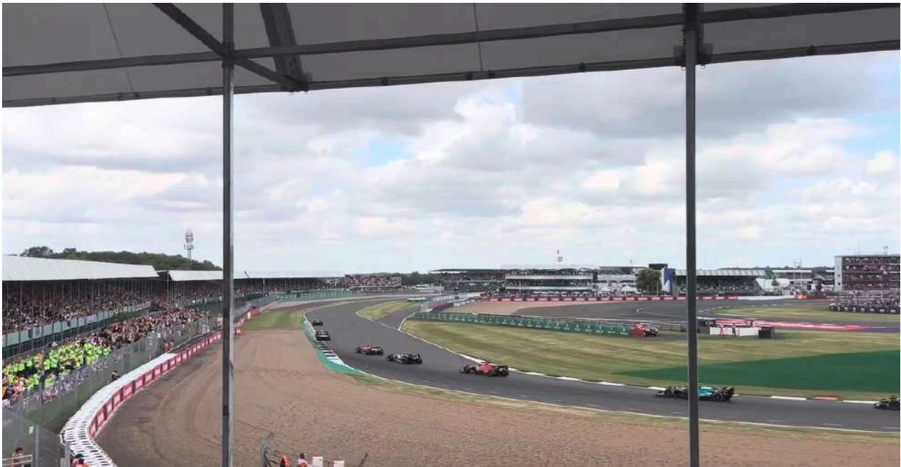
Uitzicht vanaf Luffield Grandstand

Woodcote is gelegen bij bocht 8. Door de relatief hoog gelegen tribune heeft u zicht op bocht 6 en 7. Dit zijn de bochten vlak na het rechte stuk van 'Hangar Straight'. Oftewel, de eerste drs-zone op het circuit van Silverstone. Dit is een van de goedkopere tribunes op het circuit van Groot-Brittannië.