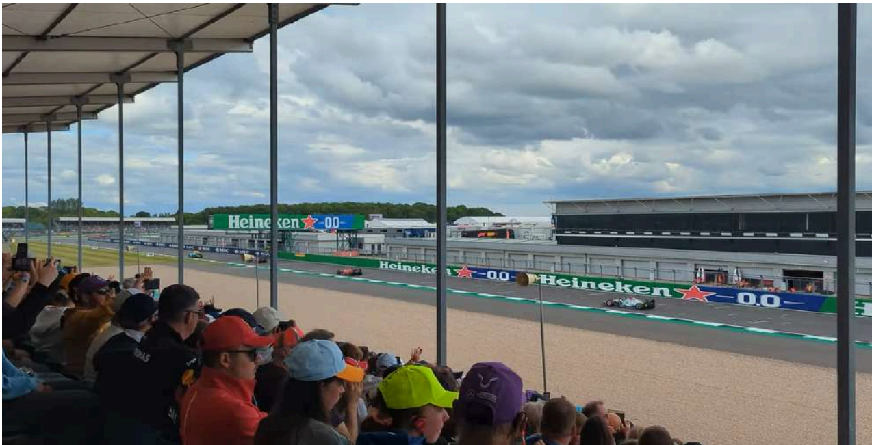
Uitzicht vanaf de National Pit Straight Tribune

Van de twee biedt Stirling B een beter uitzicht op de Copse-bocht. U kunt de auto's zien aankomen vanaf Woodcote naar de hogesnelheidsbocht Copse.