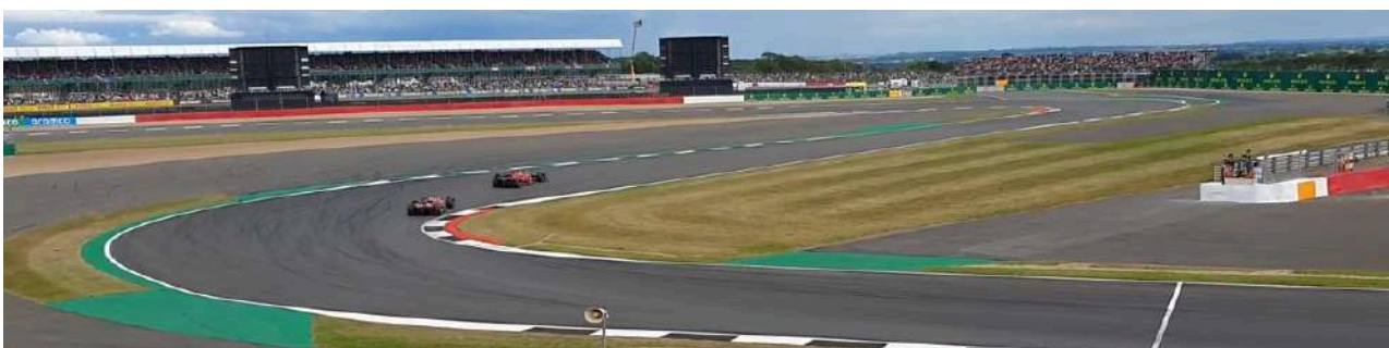
Uitzicht vanaf de Village A Grandstand

De goedkopere Village A is ook een uitstekende keuze. Zicht op een groot tv-scherm is aanwezig.