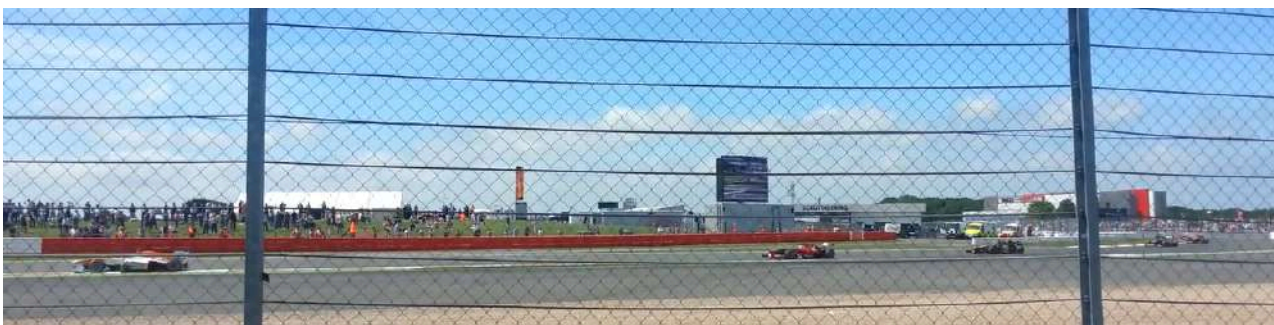
Uitzicht vanaf General Admission Copse Corner

Het is belangrijk om uw favoriete plek zo vroeg mogelijk te bezetten. En dan vooral op zaterdag en zondag, omdat de populaire gebieden snel vol lopen.