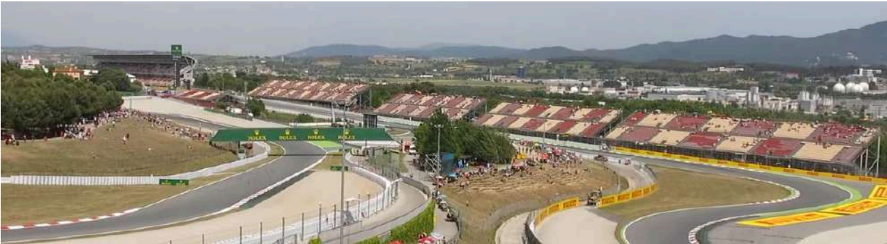
Uitzicht vanaf Tribune L

Als laatste zijn Tribune L, Tribune M en Tribune S superfan tribunes. Tribune L geeft u zicht op bocht 1, 2, 5 en 6, hier heeft u een goed overzicht van het begin van de baan! Tribune M is gelegen aan bocht 5, hier heeft u zicht op een snelle maar krappe bocht. Tribune S is gelegen naast tribune N. Het geeft u een goed uitzicht over bocht 9 en meerdere tv schermen. Het is ook overdekt.