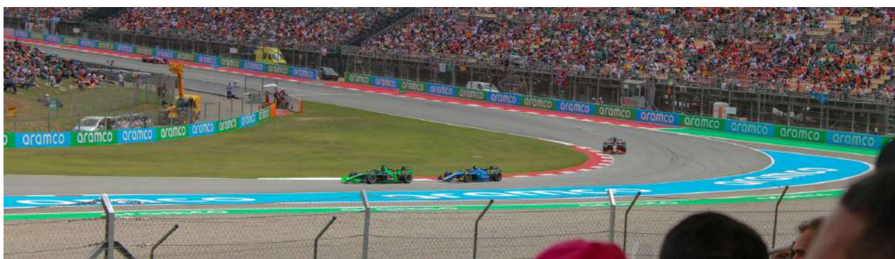
Uitzicht vanaf Grandstand A

Tribune T1 en Tribune A vallen ook onder de excellence categorie. Deze tribunes liggen aan het eind van het rechte stuk, dit geeft u zicht op bocht 1, 2 en het ingaan van bocht 3. Als laatste valt ook Tribune T10 in de excellence categorie, hier heeft u zicht op bocht 10, 11 en 12.