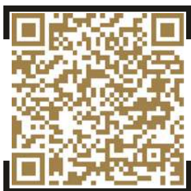
Grand Prix van Spanje Tickets