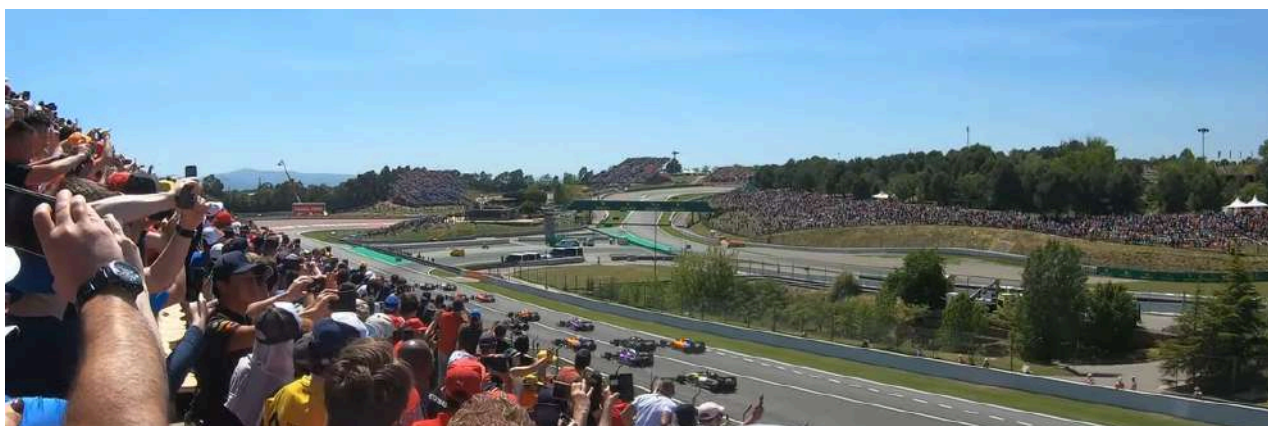
Uitzicht vanaf Tribune J

In deze categorie vallen de voordeligere Tribune J en Tribune K. Deze tribunes staan op het rechte stuk naast de hoofdtribune. In de richting van Bocht 1. Hier beleef je de start van de race en zie je wie het beste weg is vanaf de lijn.