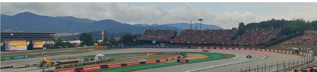
Uitzicht vanaf Tribune G

Tribune E is qua locatie vergelijkbaar aan Tribune F. Maar het eerste bochtencomplex van de baan is minder zichtbaar.